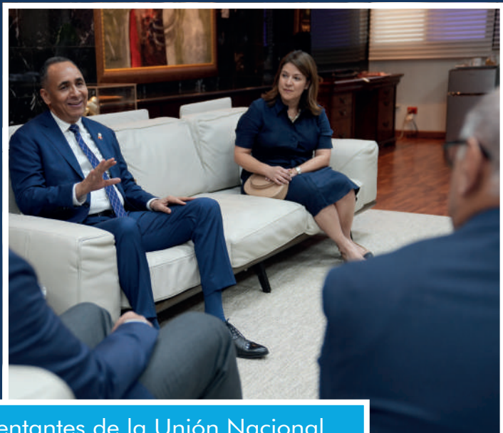
En una visita de cortesía, representantes de la Unión Nacional de Empresarios (UNE) conversaron sobre diversos temas con el titular de la Dirección General de Aduanas.