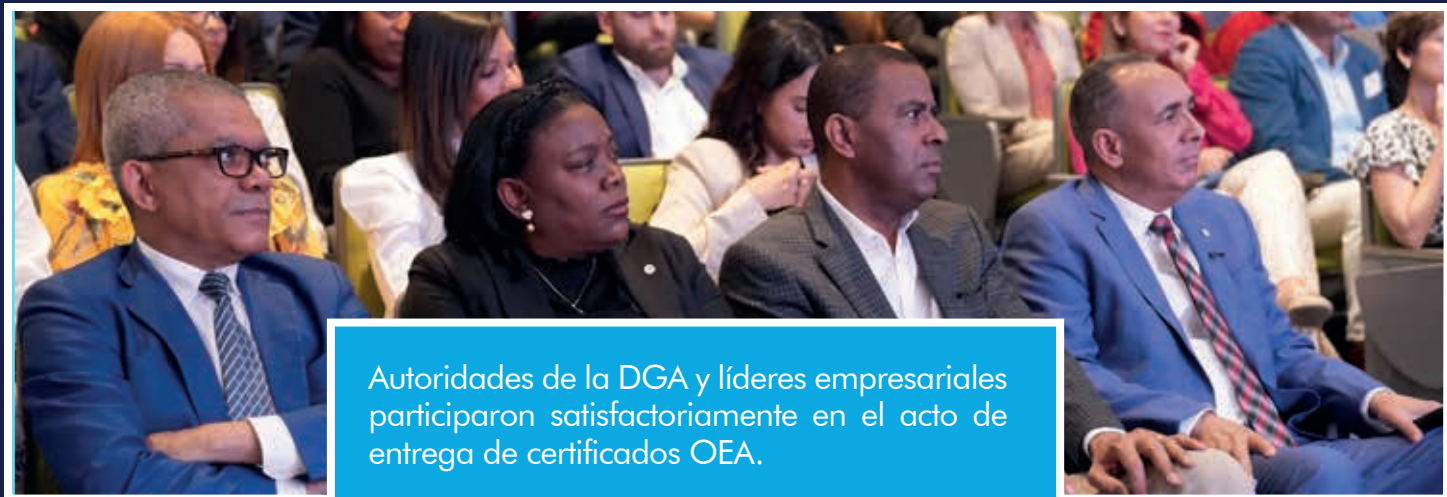
Autoridades de la DGA y líderes empresariales participaron satisfactoriamente en el acto de entrega de certificados OEA.