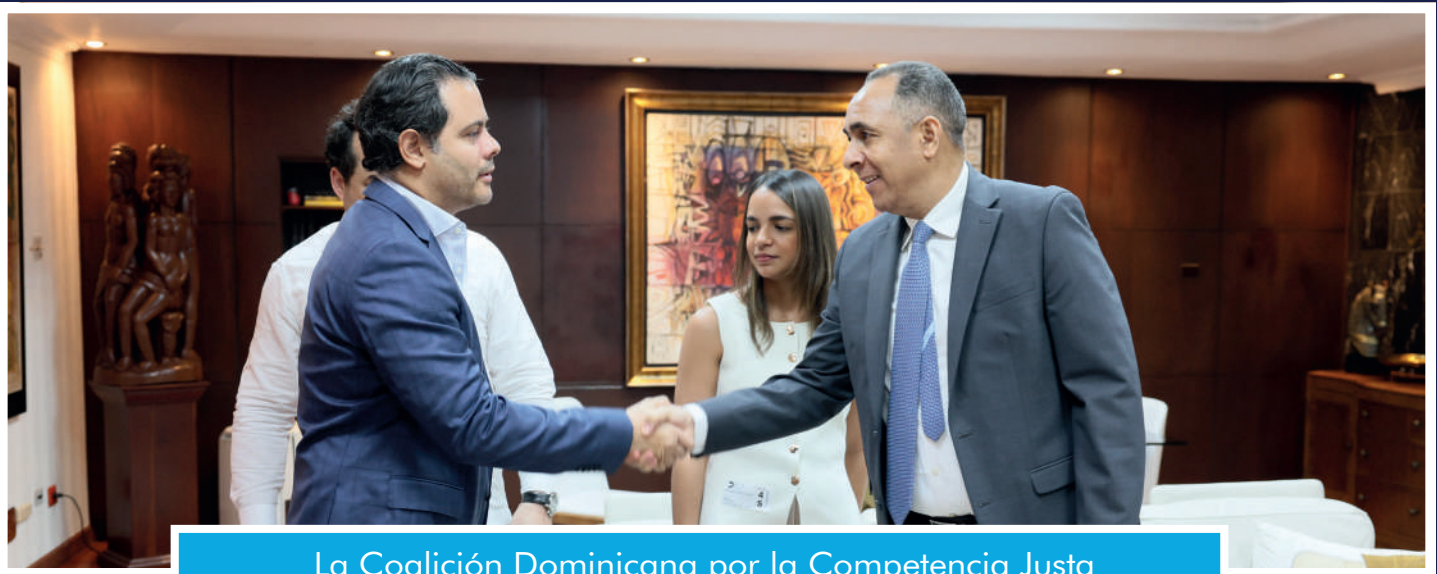
La Coalición Dominicana por la Competencia Justa (CODOCOM) sostuvo una interesante charla con el director de la entidad.

(Aditex), la Organización Nacional de Empresas Comerciales (ONEC), la Asociación Nacional de Importadores (ANI), la Federación Dominicana de Cámaras de Comercio (Fedocámaras), la Asociación de Importadores Ferreteros (Adoimfe), la Asociación de Comerciantes de la Avenida Duarte (Asoduarte), la Federación Nacional de Comerciantes (FenaceRD), el Consejo Nacional de Comerciantes y Empresarios de la República Dominicana (ConaceERD), la Asociación Nacional de Empresas e Industrias Herrera (Aneih), la Asociación Nacional de Comerciantes Dominicanos Unidos (Ancodomu), la Asociación de Comerciantes del Centro de Santiago (Asecensa), la Federación Dominicana de Comerciantes (FDC) y la Federación Nacional de Comerciantes Detallistas de Provisiones (Fenacodep).