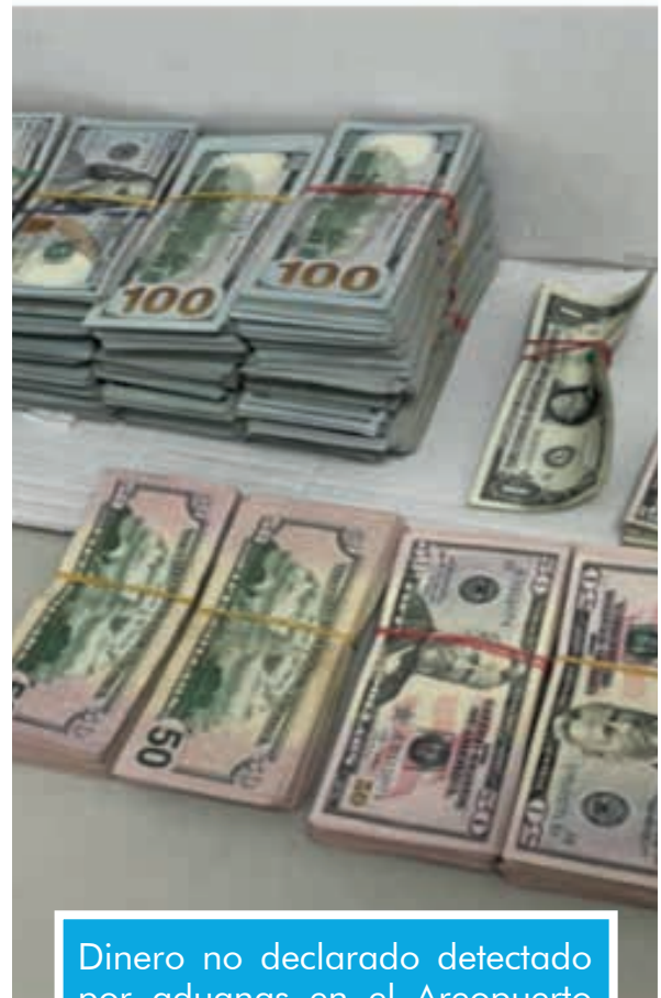
Dinero no declarado detectado por aduanas en el Aeropuerto Internacional del Cibao.

Dicha labor se realiza apoyada en tecnología y de inteligencia basada en perfilamiento de riesgos.