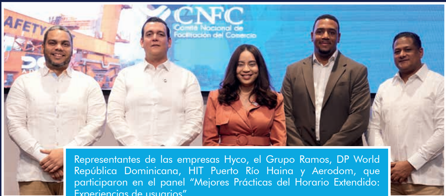
Representantes de las empresas Hyco, el Grupo Ramos, DP World República Dominicana, HIT Puerto Río Haina y Aerodom, que participaron en el panel “Mejores Prácticas del Horario Extendido: Experiencias de usuarios”.