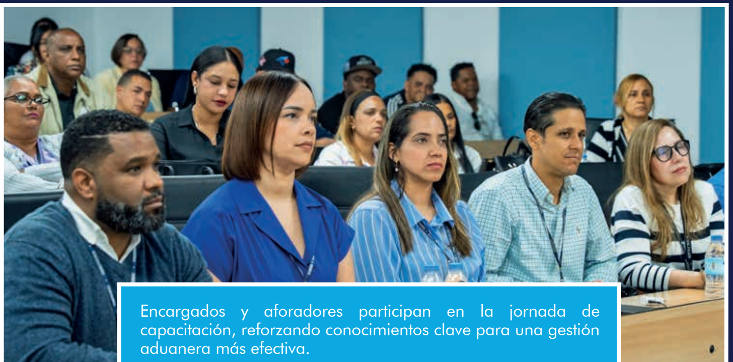
Encargados y aforadores participan en la jornada de capacitación, reforzando conocimientos clave para una gestión aduanera más efectiva.

El taller, desarrollado durante dos días, contó con la participación de más de 200 colaboradores, entre ellos encargados y aforadores, quienes mostraron un alto nivel de interés y compromiso con los temas abordados, lo que permitió reforzar conocimientos clave, promover el intercambio de experiencias y afianzar criterios técnicos orientados a una gestión más eficiente, transparente y alineada con los estándares institucionales.