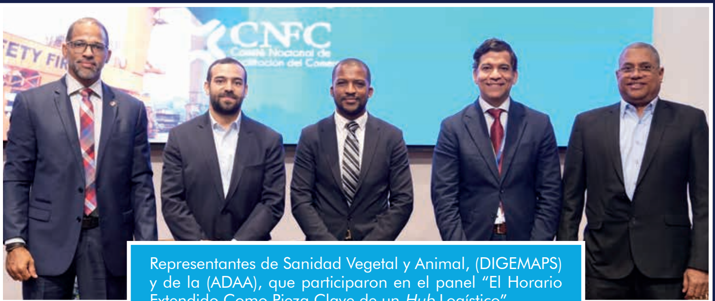
Representantes de Sanidad Vegetal y Animal, (DIGEMAPS) y de la (ADAA), que participaron en el panel “El Horario Extendido Como Pieza Clave de un Hub Logístico”.