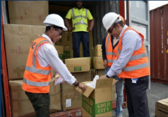
Director General de Aduanas verifica el contenido de uno de los contenedores en Caucedo.