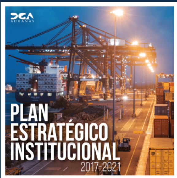
Portada del ejemplar que recoge los cinco objetivos, ejes y lineamientos del Plan Estratégico institucional de la DGA para el período 2017-2021.