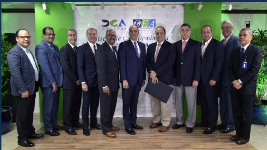
El Director de Aduanas, funcionarios de la DGA y ejecutivos de las 7 empresas certificadas como OEA.