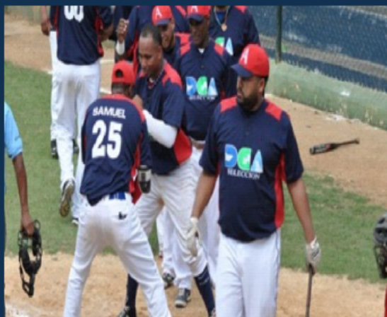
Equipo Sóftbol DGA.