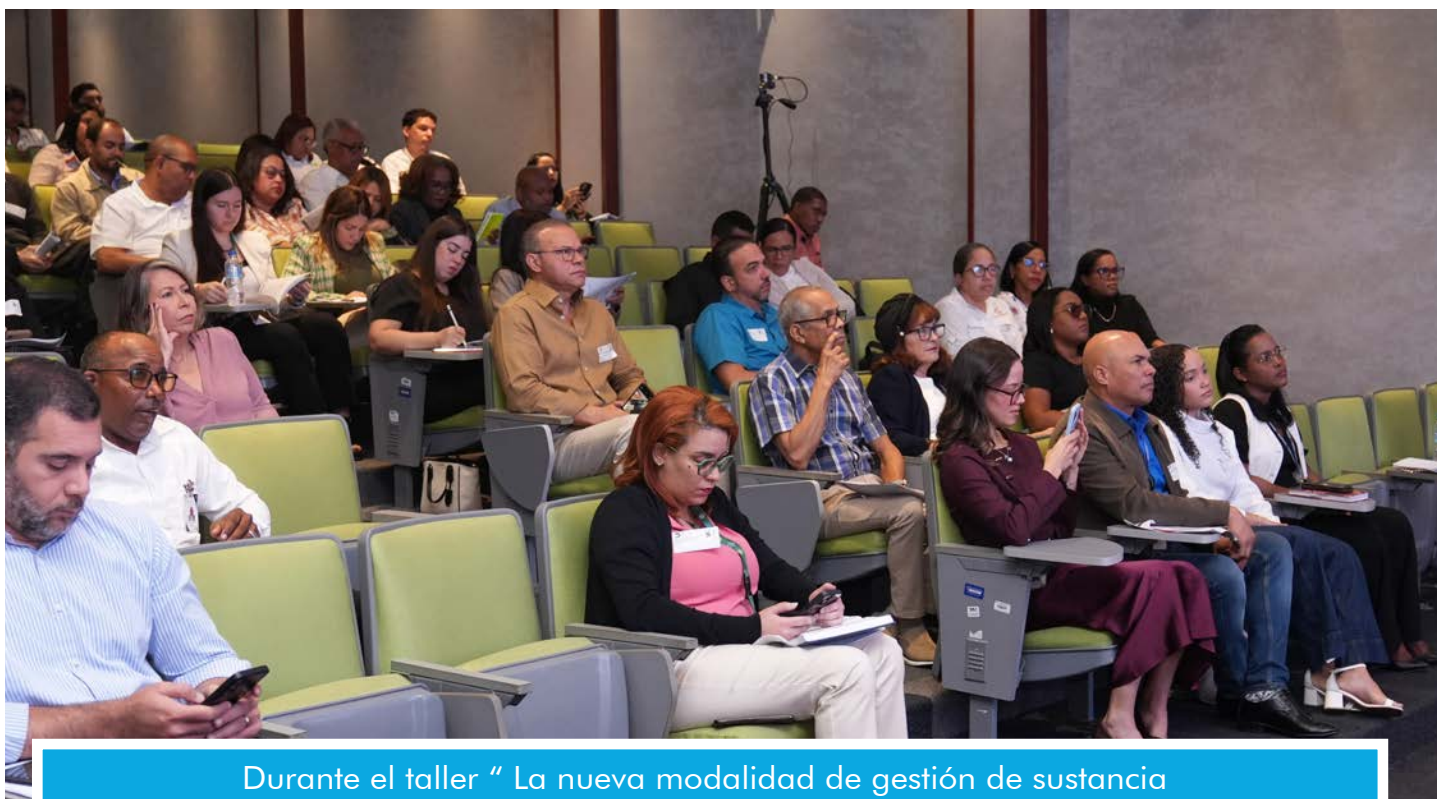
Durante el taller “ La nueva modalidad de gestión de sustancia químicas industriales”, los participantes estuvieron atentos a cada paso.