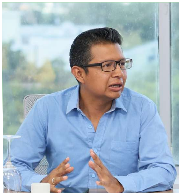
Representantes de la consultora que identificará los indicadores para medir los avances Plan Estratégico 2023-2026, discutieron con las diferentes mesas de trabajo, cuáles serían dichos indicadores.

Esa inspección conjunta incluye, además, a las mercancías de la cadena de frío, para que estas se realicen sin afectar a las cargas que, por su naturaleza, necesitan mantener cierto nivel de temperatura durante el proceso.