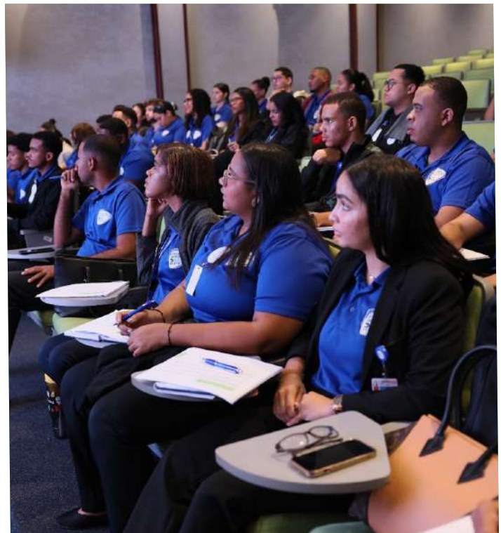
Los pasantes prestan atención a toda la información que se les brindó durante una larga jornada de capacitación.