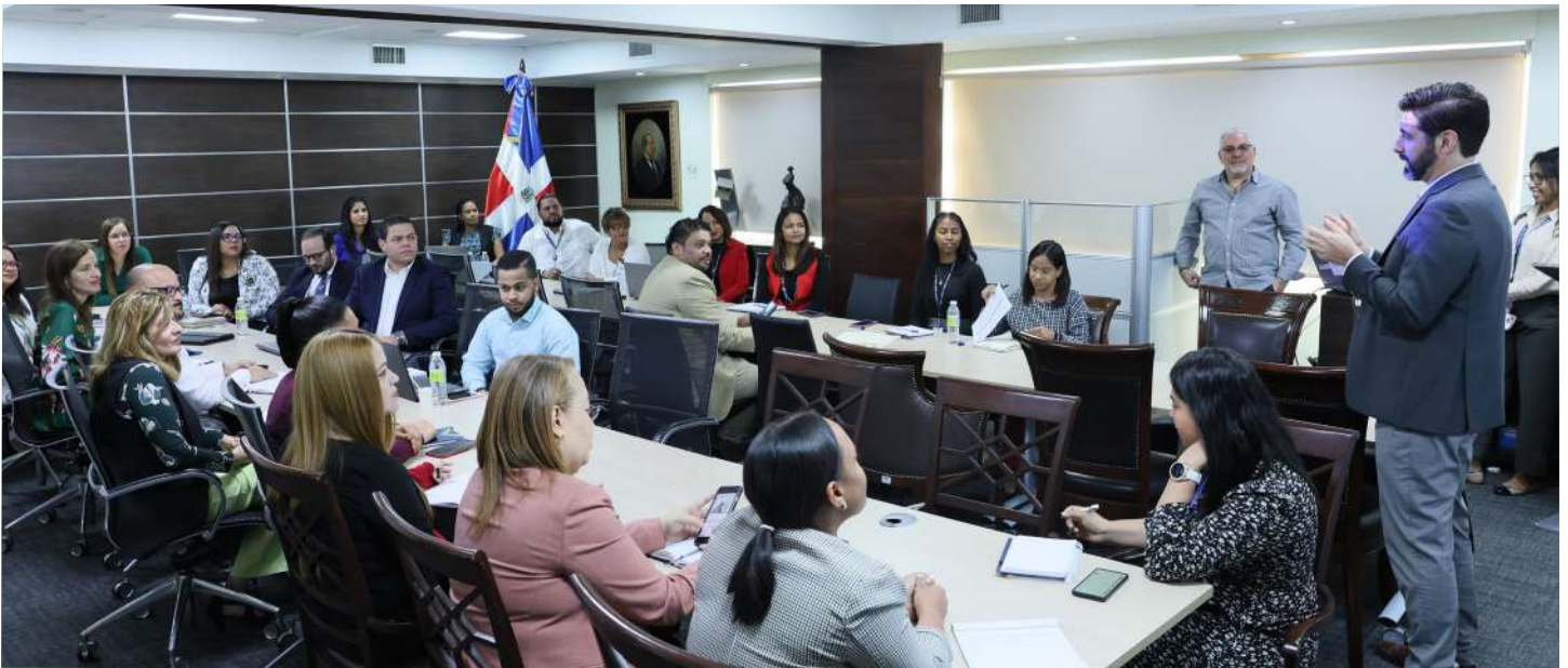
Grupo de colaboradores enlaces entre la Gerencia de Planificaciones y las demás áreas de la institución, al momento que recibían la capacitación de parte del experto enviado por el CAPTAC-RD.

del plan estratégico; recomendaciones para la elaboración del nuevo plan estratégico 2025-2028; institucional información para la toma de decisiones; sistema de información estratégica; indicadores y modelo de gestión de indicadores.