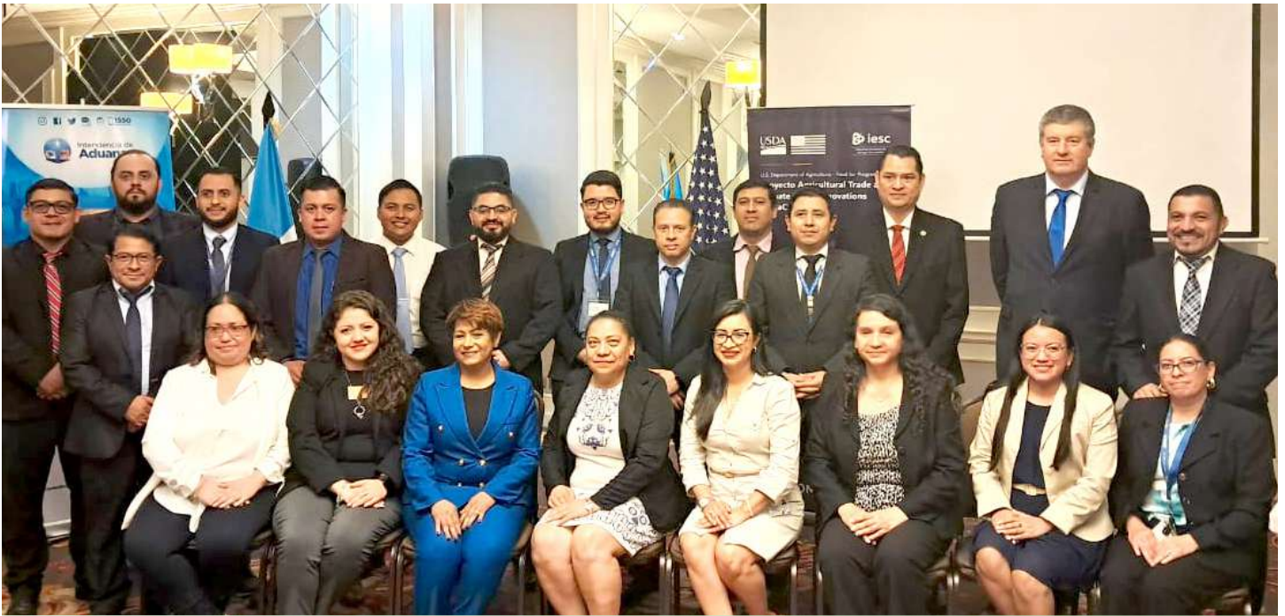
Una representación de la Unidad de Valoración en Aduana y del Departamento de Inteligencia Aduanera durante el taller impartido por la OMA en Guatemala.