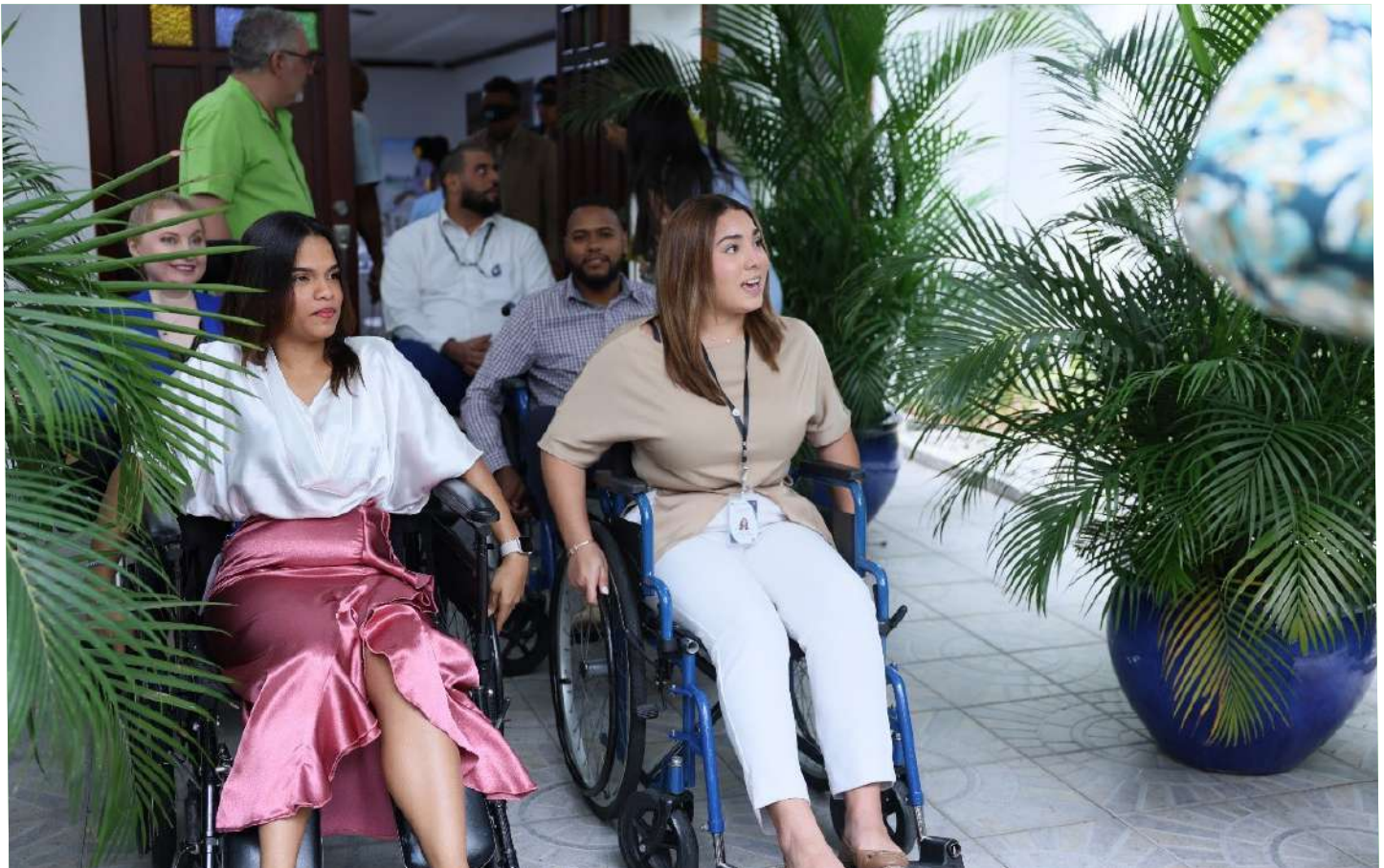
La dinámica estuvo bien entretenida en donde los colaboradores trabajaron desde otras perspectivas.

Los asistentes a la capacitación realizaron prácticas, simulando discapacidad auditiva, visual, en sillas de ruedas, caminando con bastón.