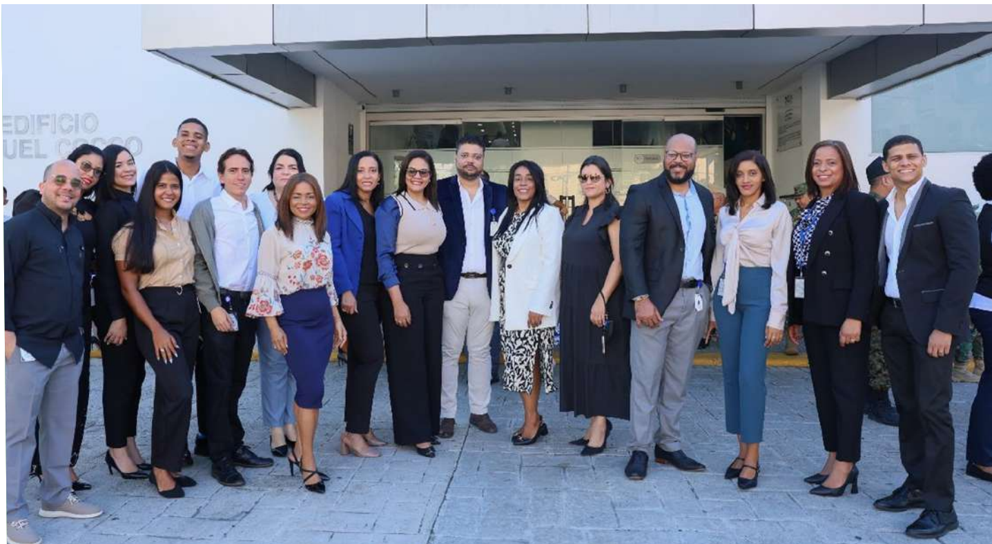
En franca camaradería los colaboradores y ejecutivos de Aduanas celebraron el Día Nacional de las Aduanas.