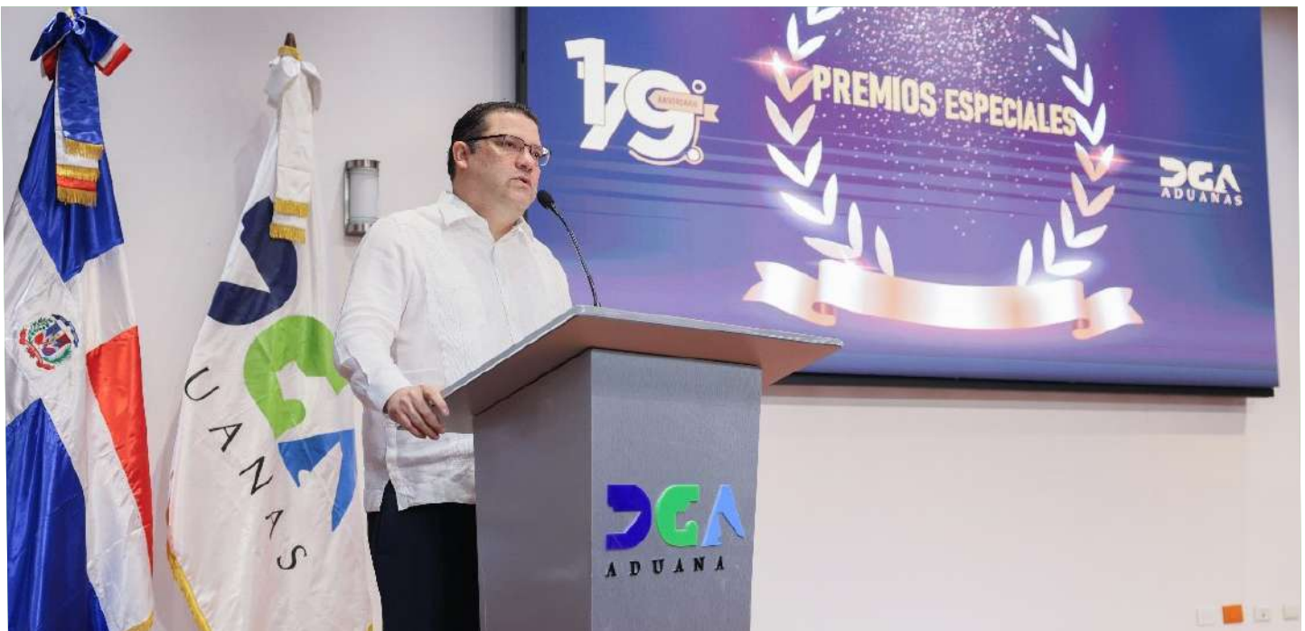
El director general de Aduanas, Eduardo Sanz Lovatón, dio palabras de emoción a todos los reconocidos.