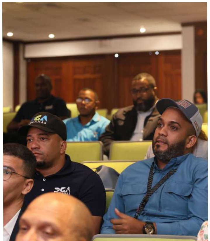
Colaboradores del área jurídica de DGA y algunos fiscales y abogados del Ministerio Público.

Además, destacaron en este taller que, anteriormente, sus nombres eran reconocido como Emenegildo Zegna, ZZegna y ZegnaSport, pero actualmente fusiona bajo la marca única ZEGNA. En Otoño-Invierno de 2022, fue la primera colección completa de su nueva marca.