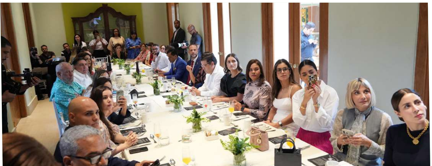
Los asistentes al evento prestando atención a la visita guiada por el Museo Virtual Miguel Cocco.