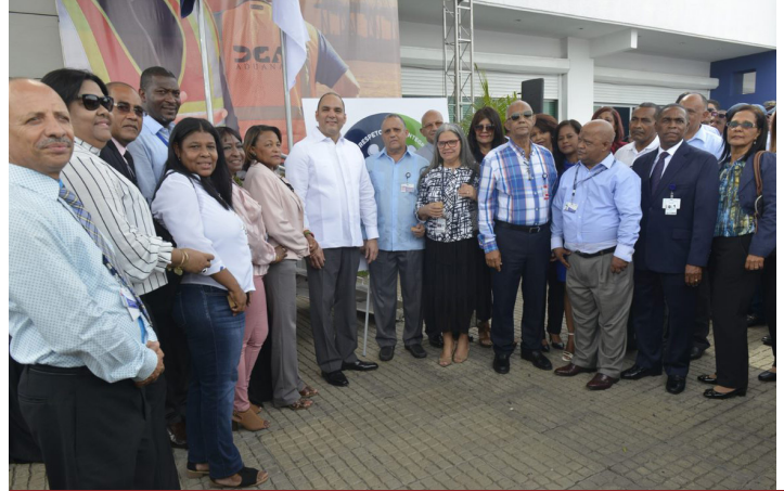
El director general de Aduanas, junto a colaboradores meritorios.

La ocasión fue celebrada junto a autoridades del Cuerpo Especializado de Seguridad Portuaria, Autoridad Portuaria Dominicana, directivos de Haina International Terminals, operadora del puerto, la Asociación de Agentes de Aduanas, así como funcionarios y colaboradores de la institución, a quienes estuvo dedicada la actividad, en el transcurso de la cual Nilka Duvergé, administradora de Aduanas, entregó una placa de reconocimiento al Director General por su esfuerzo en la gestión y apoyo a las ejecutorias.