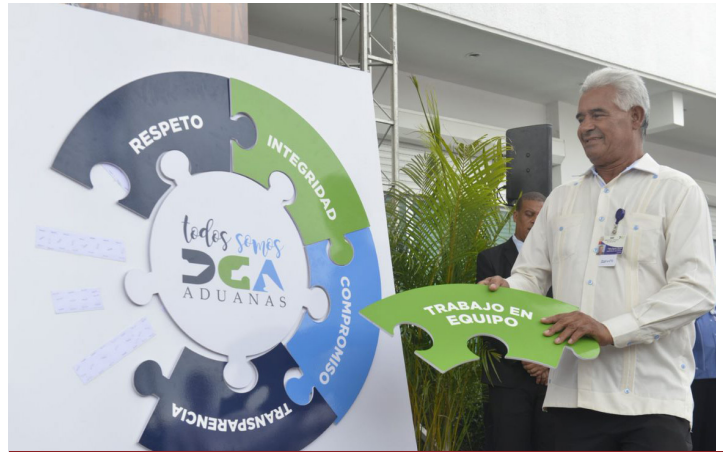
Los valores que nos esfuerzan día tras día como servidores públicos. Un acto simbólico durante el encuentro.