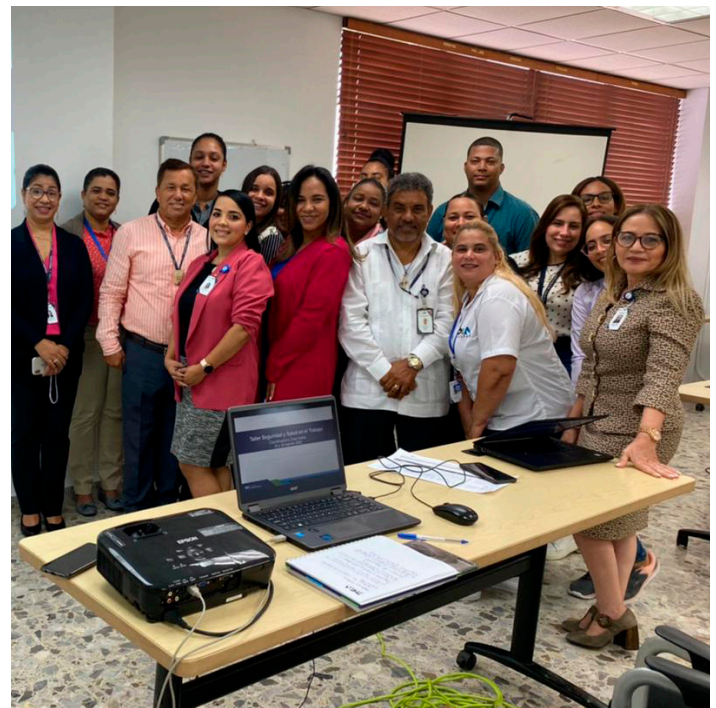
El personal capacitado en el Taller Seguridad y Salud en el Trabajo.