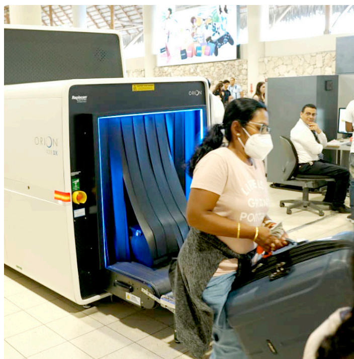
Proceso de revisión de los equipajes con la nueva máquina.

todos sus procesos aplicando tecnología de punta, en beneficio de todos los turistas y los dominicanos residentes en el exterior que nos visitan a través de ese aeropuerto.