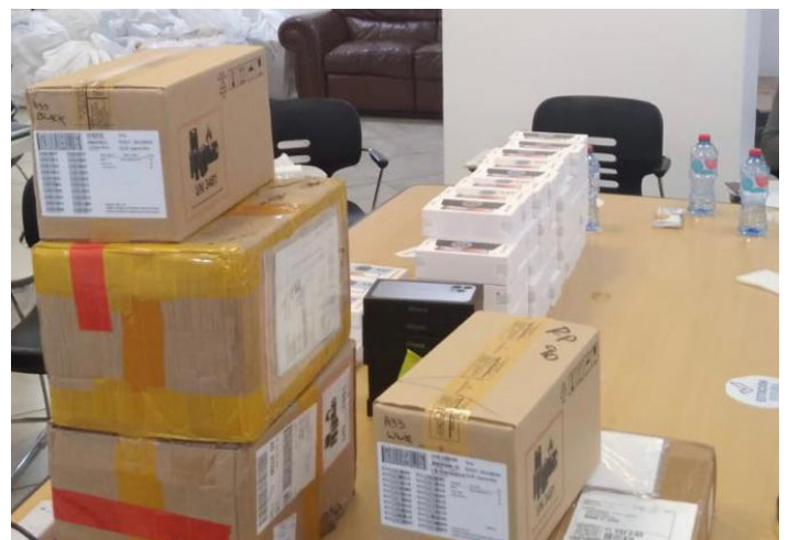
Parte del cargamento ilícito decomisado de dispositivos electrónicos, por la DGA.

En los últimos meses, la Dirección General de Aduanas ha detectado e impedido varios intentos de contrabando de mercancías ilícitas, reafirmando su compromiso en combatir el trasiego ilegal, comprometida con la transparencia y eficiencia de su gestión.