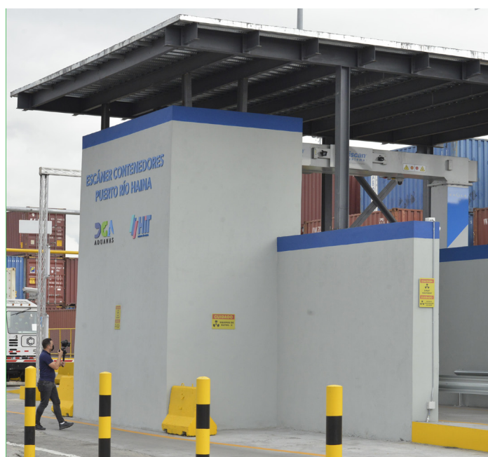
Maquina de Rayos X instalada en el puerto de Haina oriental.

nueva Ley de Aduanas, la cual sustituyó a una legislación de 68 años de antigüedad, y luego lanzó oficialmente la plataforma tecnológica de Motor de Riesgo “MOR”. También, implementó varias mejoras en la Ventanilla Única de Comercio Exterior (VUCE), y aumentó las certificaciones para Operador Económico Autorizado (OEA), orientadas a facilitar las exportaciones. Todas estas mejoras y programas han impactado positivamente