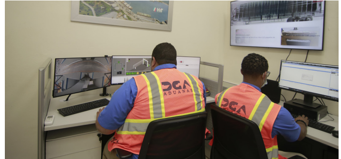
Equipo de monitoreo de la maquina de Rayos X.

El Plan Estratégico desarrollado por la actual gestión para el periodo 2022-2026 coloca en primer orden la transparencia, la institucionalidad y la calidad de los servicios. En ese sentido, la DGA, inició, en abril, la implementación de las normas ISO 37001 de Sistemas de Gestión Antisoborno e ISO 37301 sobre Sistemas de Gestión de Cumplimiento Regulatorio, como estándares en todos sus servicios.