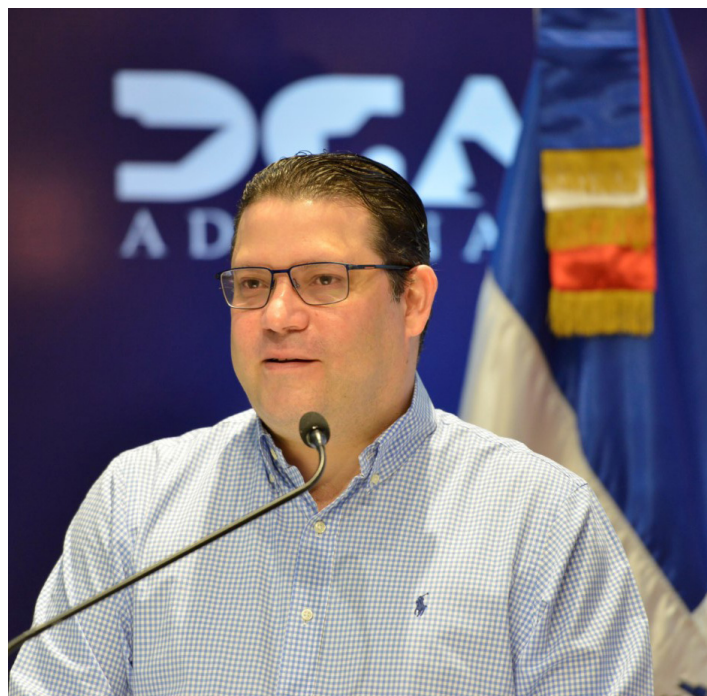
Eduardo Sanz Lovatón, director general de Aduanas.

Al presentar los logros de sus dos años de gestión, el director general de Aduanas, Eduardo Yayo Sanz Lovatón, resumió que se está creando una nueva Aduanas en el país. Un ejemplo palpable es el programa, Exporta+, implementado por la DGA en