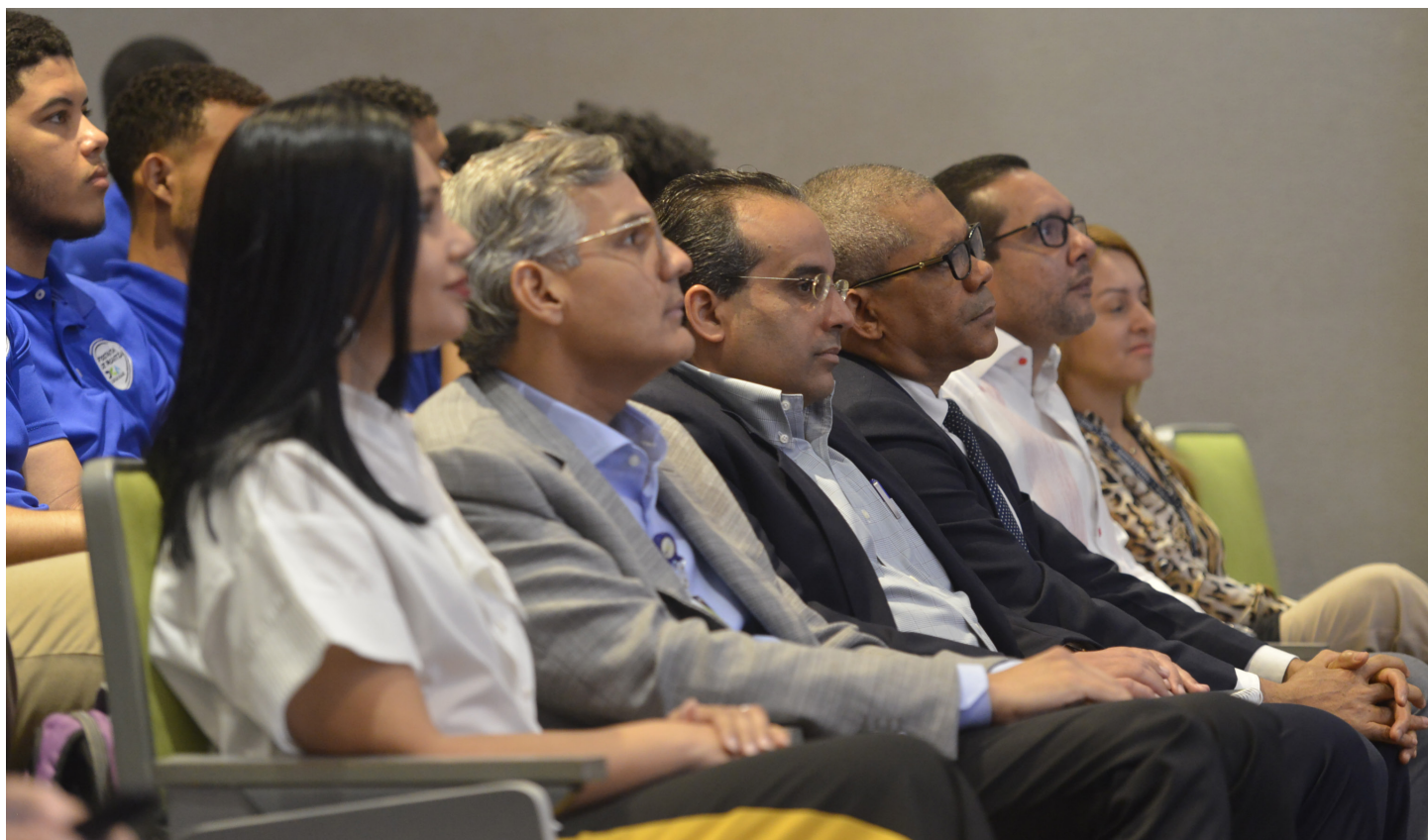
Colaboradores de la DGA presente en el lanzamiento de la quinta entrega del programa “Pasantías DGA”

En el acto de lanzamiento de la quinta promoción “Pasantías DGA” estuvo una representación de versiones anteriores del programa, donde se resaltó el impacto que ha tenido esta herramienta en sus vidas, pues, casi en su totalidad están insertos en el mundo laboral.