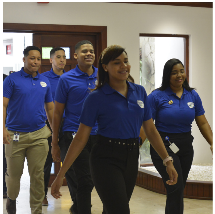
Parte de los estudiantes que entran a esta quinta versión de Pasantías DGA.

toquen las puertas, exijan, den más de lo que se les pida, den la milla extra, aprendan a trabajar en equipo y a ayudar al compañero que tienen al lado”.