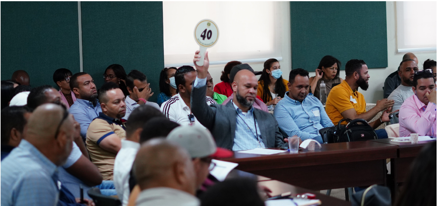
Parte de los ofertantes que se presentaron en la subasta.