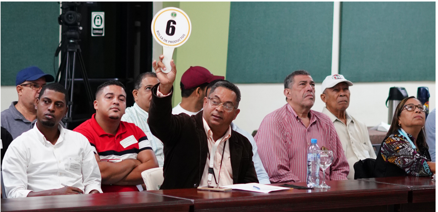
Momentos de pujas entre los presentes.

La operación se realizó posterior al aviso publicado en medios escritos de circulación nacional, los días 29 de julio y 1 de agosto de 2022, conforme a lo previsto en la Ley de Aduanas Núm. 168-21 en su capítulo VI De la subasta de mercancías, artículos del 121