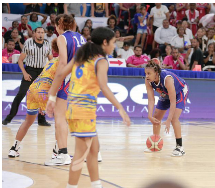
Las jóvenes del baloncesto hicieron un buen trabajo.