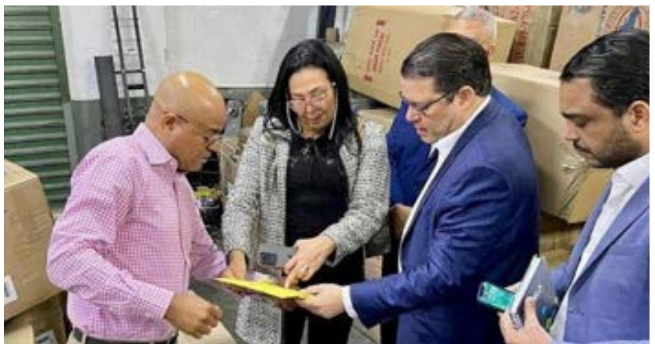
El viaje sirvió para que las asociaciones compartieran con el director de la DGA