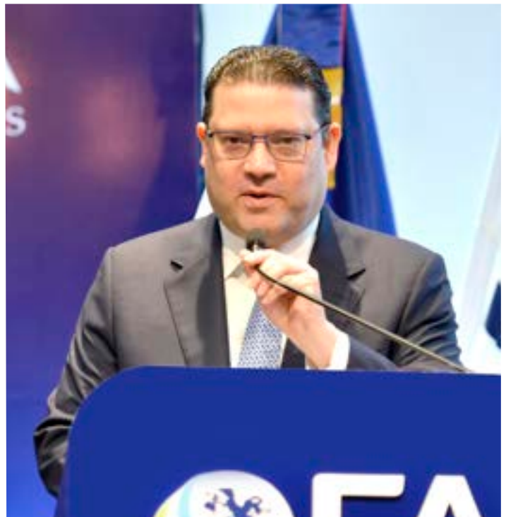
Director de la DGA, Eduardo Sanz Lovatón

Se estarán realizando una serie de capacitaciones para todos los niveles de colaboradores de la DGA. El objetivo general es dar a conocer a nivel interno y externo el Código de Ética y Conducta de la DGA, para que los colaboradores y relacionados de la institución estén en cumplimiento con el manual.