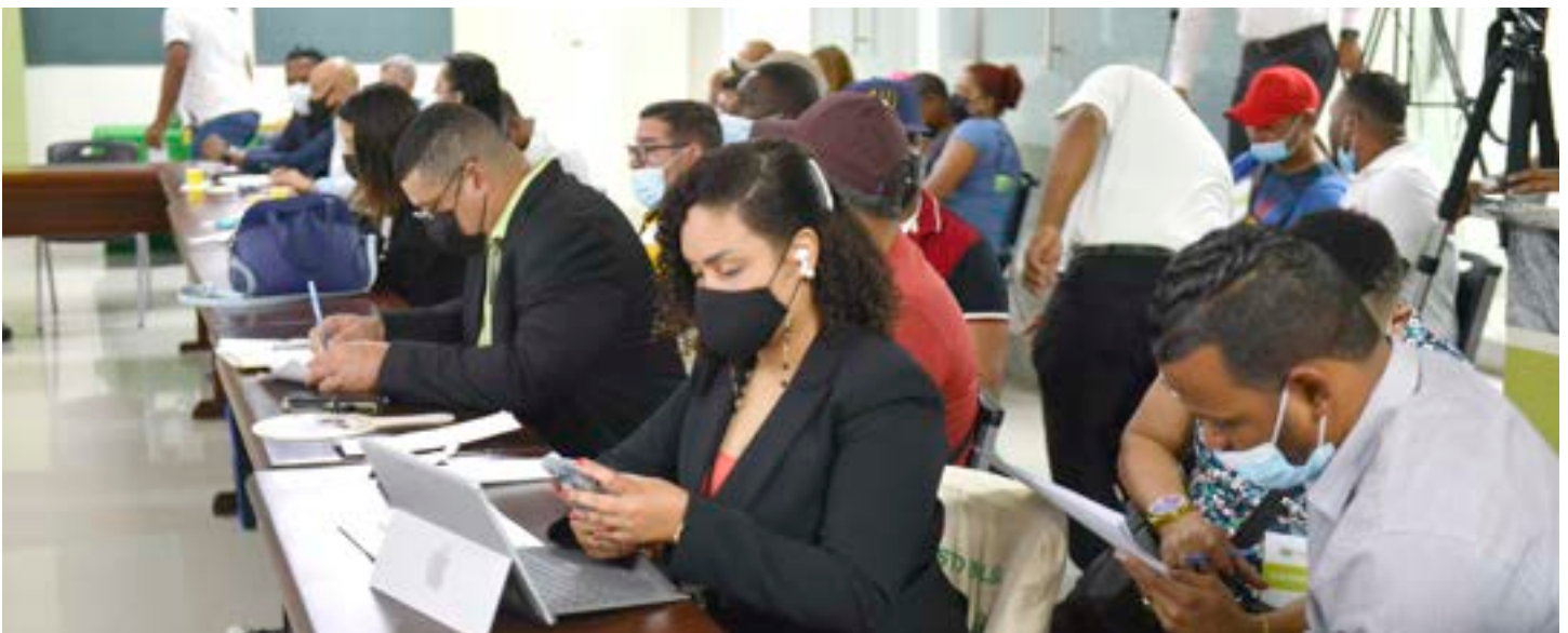
Momentos en que los participantes de la subasta hacían sus ofertas

La operación se realizó posterior al aviso publicado en medios escritos de circulación nacional, el día 2 de febrero de este año y conforme a lo previsto en la Ley de Aduanas Núm. 168-21 en su capítulo VI De la subasta de mercancías, artículos del 121 al 136, para el régimen de las Aduanas con la que se invitó a participar a comerciantes, importadores y empresas organizadas, legalmente establecidas en el país, así como público en general.