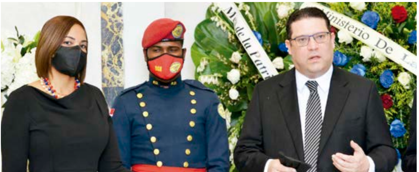
Director de la institución al momento del discurso de rendición de honores en el Altar de la Patria.

Santo Domingo. En el marco del “Mes de la Patria 2022”, la Dirección General de Aduanas (DGA), depositó una ofrenda floral en el Altar de la Patria para rendir tributo a los padres fundadores de la nación.