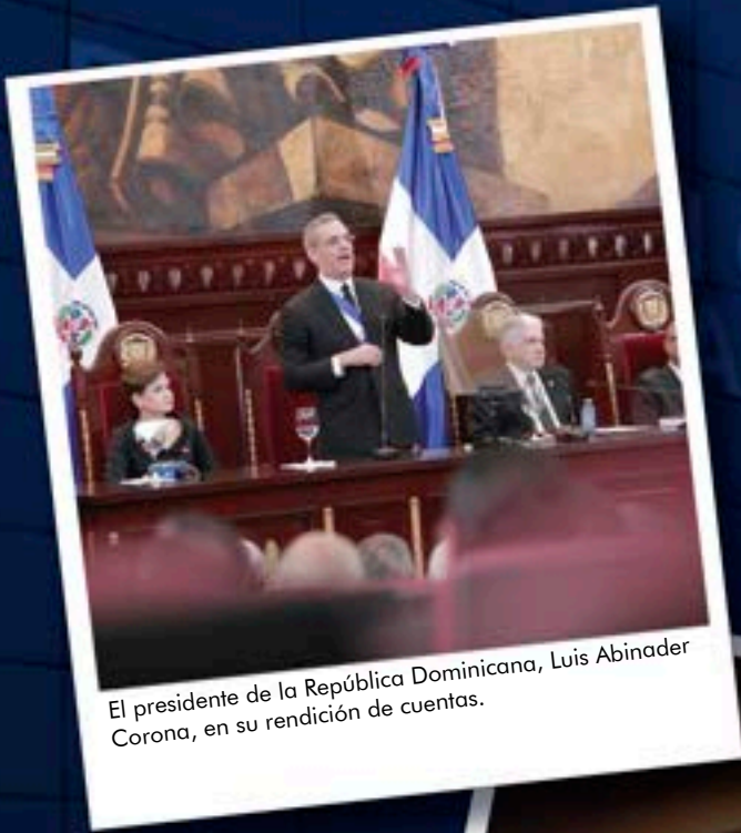
El presidente de la República Dominicana, Luis Abinader Corona, en su rendición de cuentas.