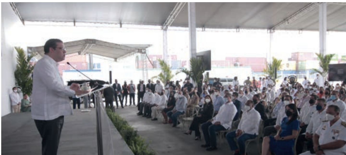
Funcionarios de la Dirección General de Aduanas en la presentación del escáner.

Recordó que Rapiscan es hoy una realidad gracias a que el año pasado la empresa que él representa y la Dirección General de Aduanas firmaron la carta de intención para la instalación de esta valiosa herramienta.