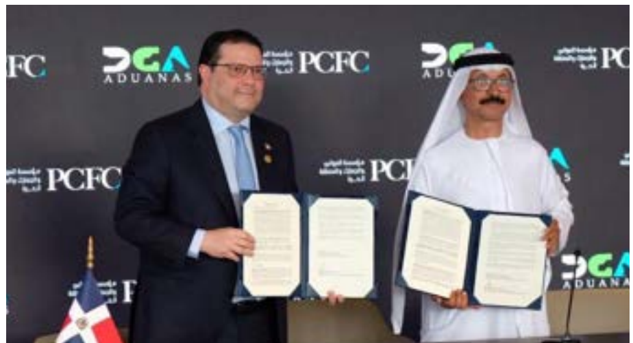
Sanz Lovatón y Ahmed Bin Sulayem en la firma de acuerdo entre República Dominicana y los Emiratos Árabes Unidos.

proceso, se enmarca en la estrategia de transformación y readecuación tecnológica que ha implementado la DGA en los últimos 18 meses, y que forma parte de los esfuerzos para aumentar la competitividad del país a nivel regional.