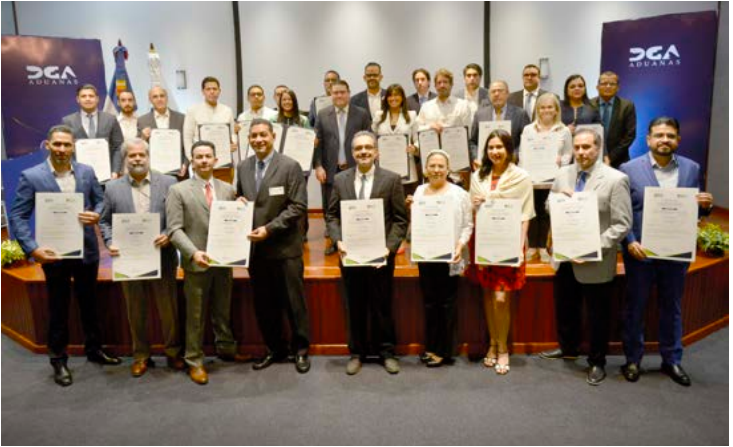
Representantes de las 60 empresas certificadas posan para una fotografía con sus certificados.