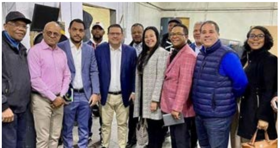
El titular de la DGA, Eduardo Sanz Lovatón, reunido con ejecutivos de asociaciones de empresas de envíos.

El funcionario aduanero se expresó confiado de que, tras haber agotado esa apretada agenda de reuniones con los consolidadores de carga, tanto los dominicanos en el país como los del exterior estarán, pronto, siendo más beneficiados por la entidad aduanera.