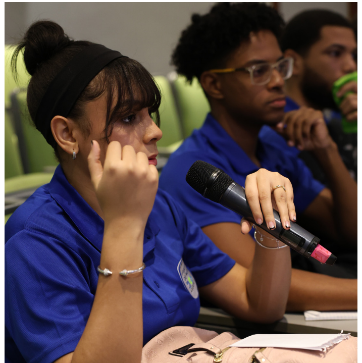
Joven pasante interviene y hace preguntas durante el taller.

Estos jóvenes se encuentran ubicados en las distintas administraciones de Aduanas, como: puerto de Haina, Caucedo, puerto de Santo Domingo, aeropuerto Cibao, aeropuerto La Romana y AILA, en este último, en las áreas de correo expreso, pasajeros y cargas.