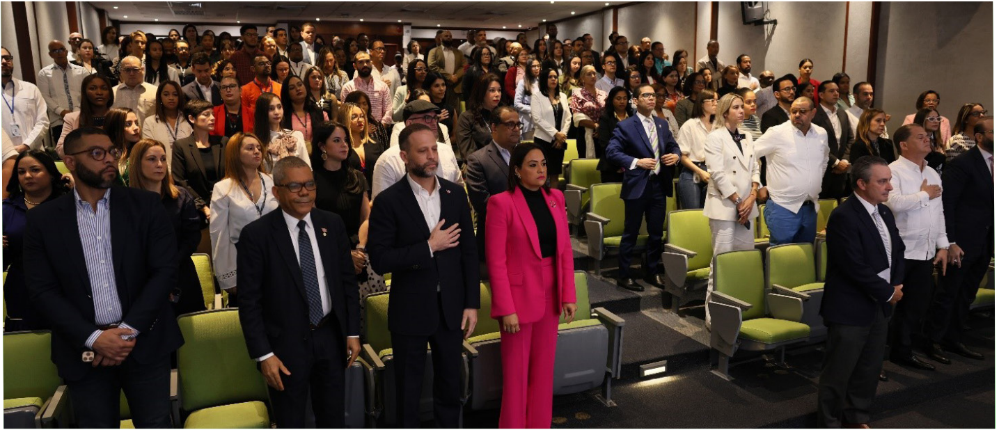
La actividad del Día Internacional de las Aduanas estuvo bien concurrida.

El funcionario significó, además, la meta que tiene la institución, de incorporar la inteligencia artificial a todos los servicios y operaciones aduaneras, sobre la cual ha venido trabajando.