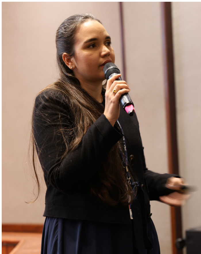
Colaboradora de la DGA interviene y hace preguntas durante el taller.

En el evento se abordaron aspectos esenciales para establecer metas alineadas al Plan Estratégico Institucional y al Plan Operativo Anual.