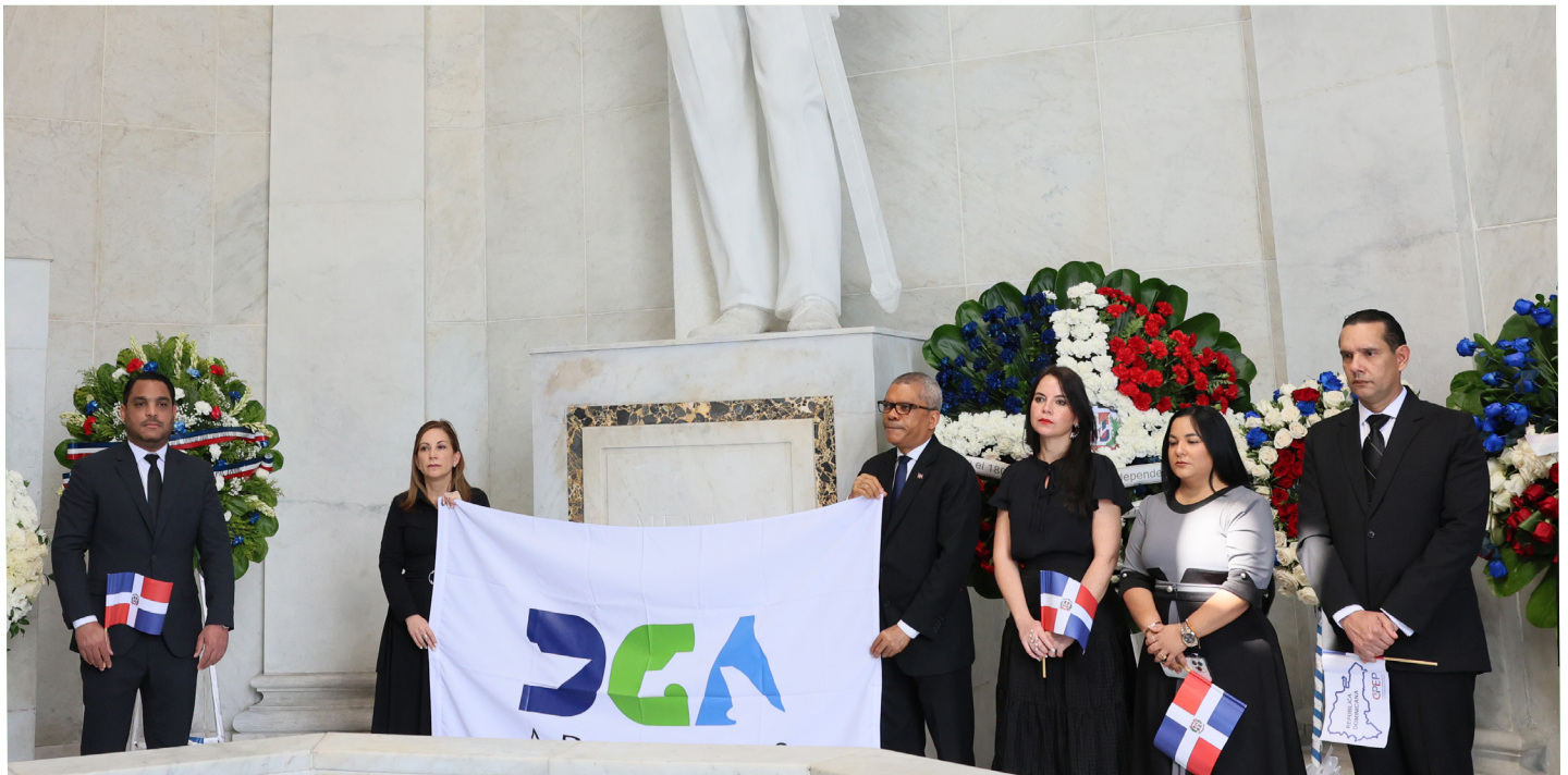
Una comitiva integrada por ejecutivos y colaboradores de Aduanas estuvo depositando la ofrenda floral en el Altar de la Patria.

Efemérides Patrias (CPEP), que va desde el 26 de enero y en esta ocasión se extenderá hasta el nueve de marzo para incluir el natalicio del patricio Francisco del Rosario Sánchez.