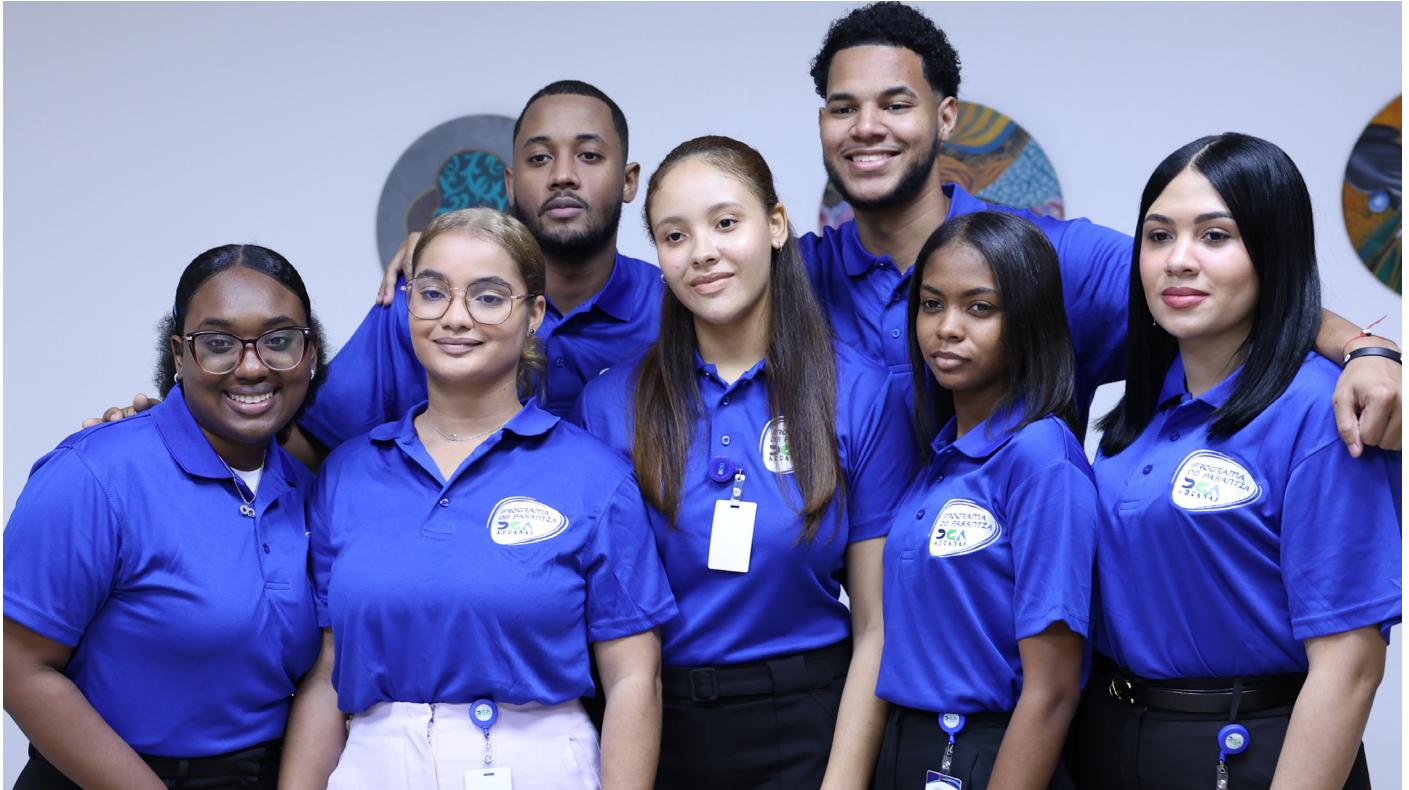
Parte del nuevo grupo de pasantes durante su primer día en la institución, donde fueron recibidos por las principales autoridades.