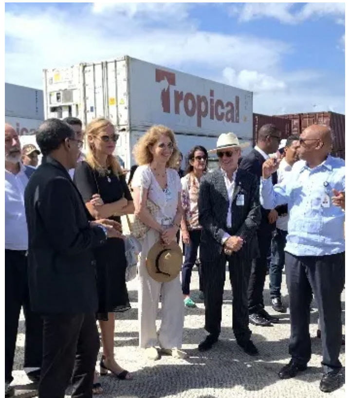
Los diplomáticos visitaron también algunos puertos.