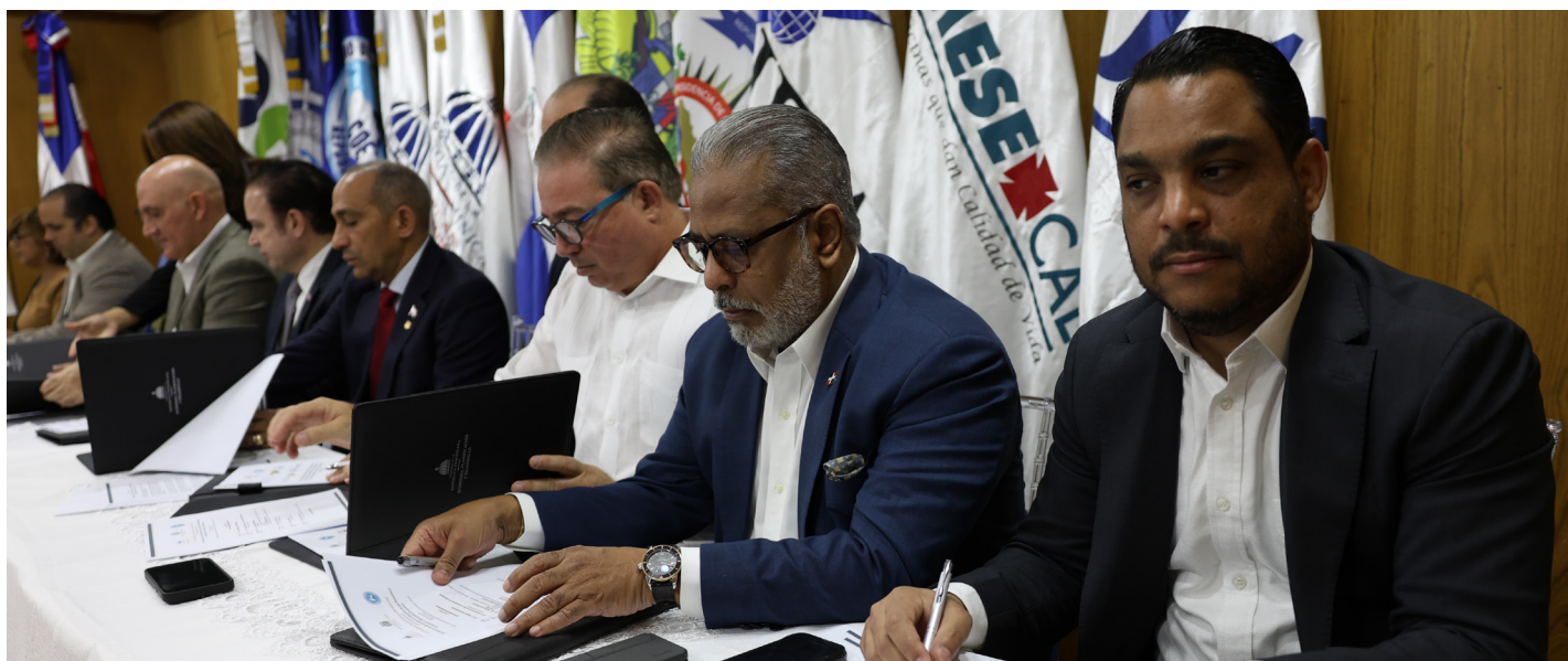
Representantes de las instituciones del Gobierno firman el acuerdo interinstitucional en un acto protocolar en la sede del Ministerio de Economía, Planificación y Desarrollo, ente rector de la cooperación internacional no reembolsable.