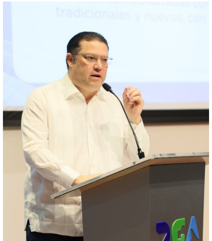
El director general de Aduanas, Eduardo Sanz Lovatón se dirige a los presentes.

El director de Aduanas, también, subrayó iniciativas destacadas de su gestión como la implementación de rayos x en puertos y aeropuertos, gracias a los cuales más del 90 % de la carga que sale y entra al país es revisada de manera no intrusiva, las mejoras al motor de riesgo para el perfilamiento de la carga y la promulgación de la Ley de Aduanas 168-21 con la cual se adecuó el marco jurídico nacional en materia aduanera a los nuevos tiempos.